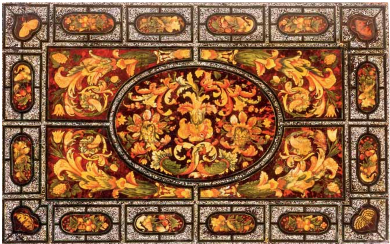
Table d'écaïlle de tortue, peinte de fleurs, rinceaux et papillons à compartiments semés de nacre de perle, fournie par Pierre Gole en 1663 pour Vincennes, détail : le plateau. Musée Smidt van Gelder, Anvers.