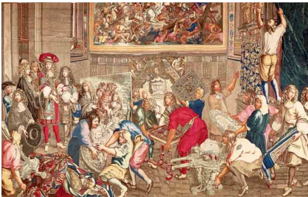
La Visite du Roi Louis XIV aux Gobelins , tapisserie d'après le dessin de Charles Le Brun, vers 1667, avec au centre de la composition, prêt à montrer une table au Roi, un artisan qui pourrait être Pierre Gole. Château de Versailles.

Inventaire après décès de Pierre Gole, 10 janvier 1685 Liste des fournitures royales de Pierre Gole d'après les Mélanges Colbert Liste chronologique des meubles représentés, faits par ou attribués à Pierre Gole Liste des espèces de bois d'après l'inventaire de 1685 Bibliographie Index des noms cités