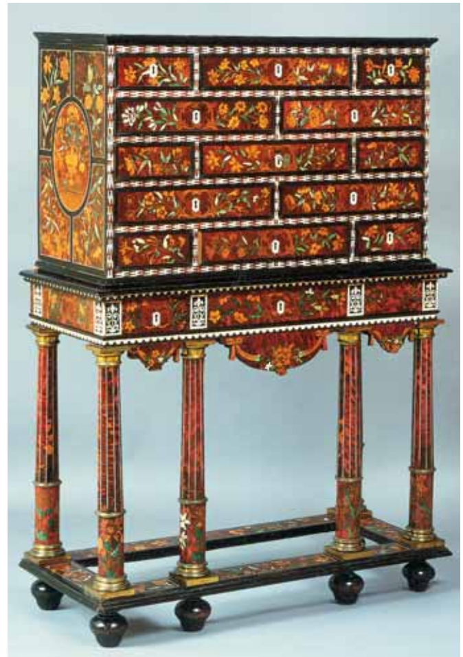
Cabinet à tiroirs, décoré de marqueterie à fleurs sur écaille, vers 1662, par Pierre Gole. Rijksmuseum, Amsterdam.