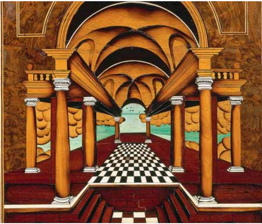
Cabinet décoré d'écaille et de marqueterie à fleurs, vers 1665, attribué à Pierre Gole, détail : le dos de la porte centrale. Burghley House, Angleterre.