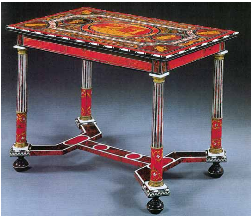
Table décorée de marqueterie d'écaille, d'ivoire et d'ébène, vers 1665, attribuée à Pierre Gole.