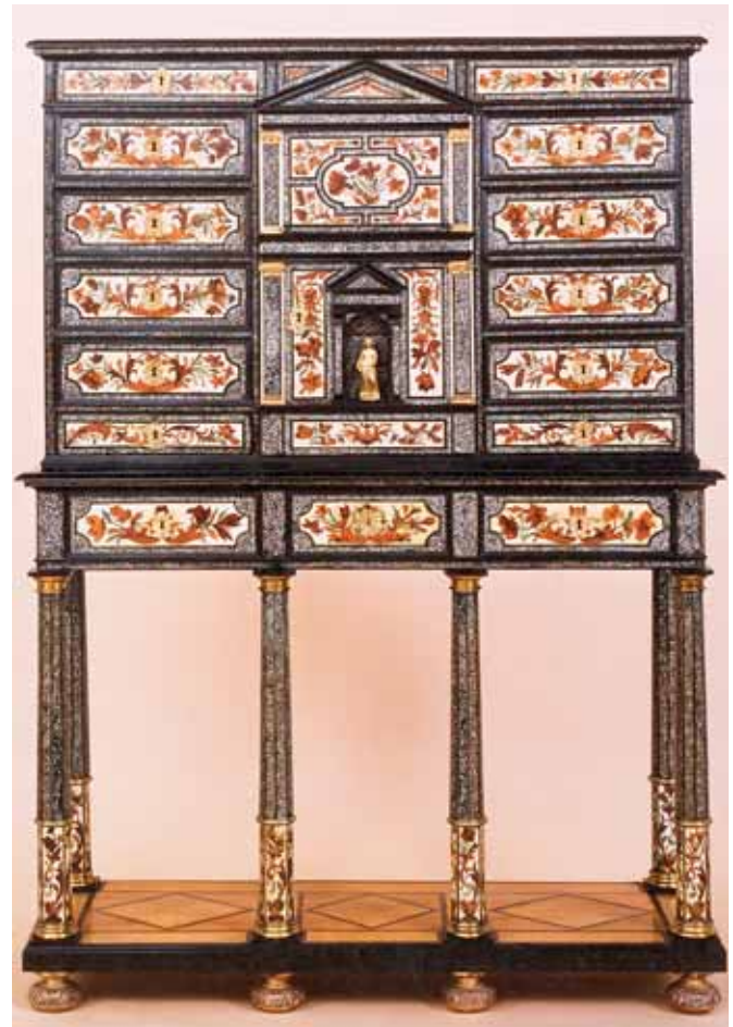
Cabinet décoré de marqueterie de fleurs sur fond d'ivoire, encadré par des bordures en laque, relevées de nacre de perle, vers 1665, attribué à Pierre Gole. The Wendy and Emery Reves Collection, Dallas Museum of Art.