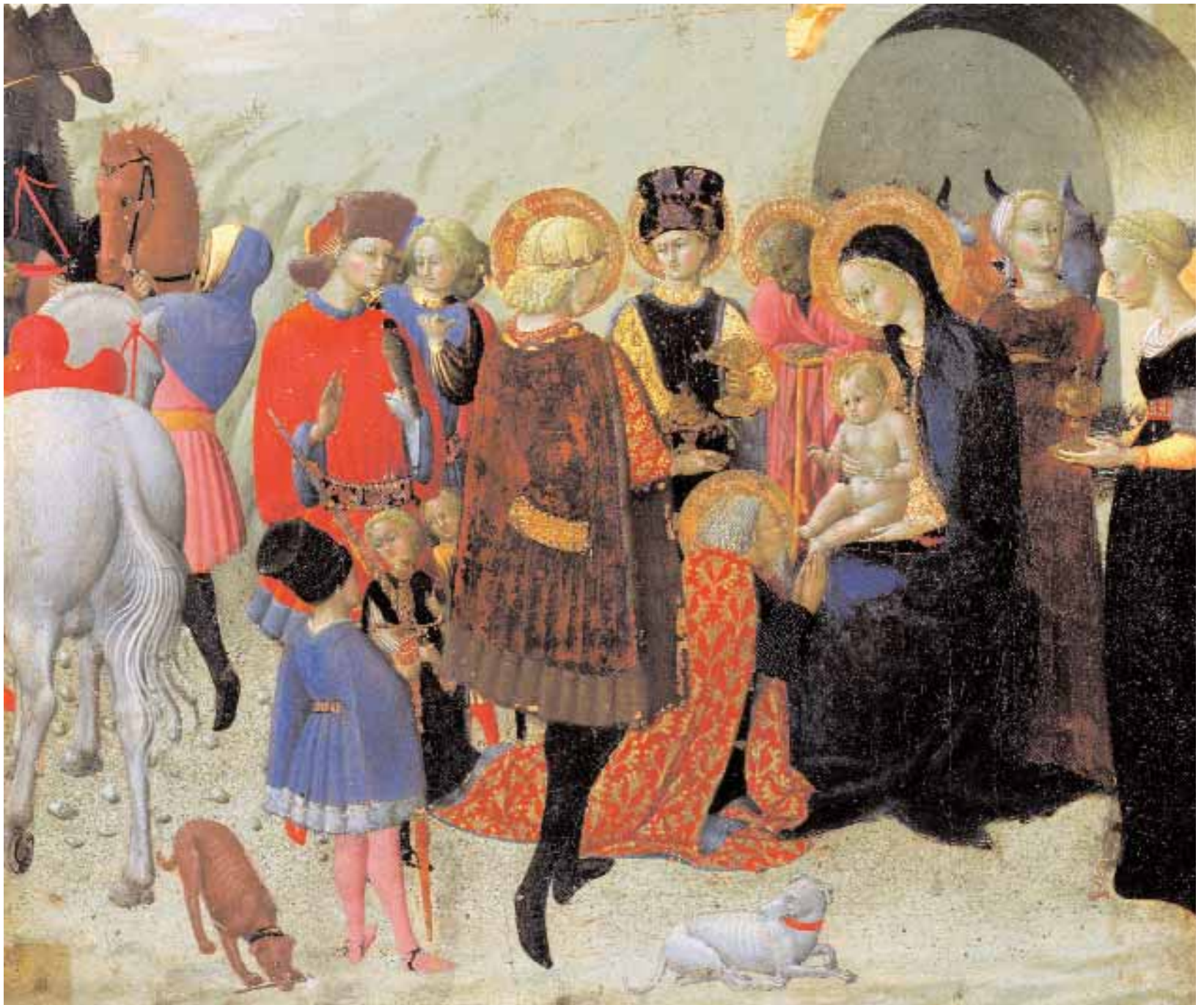
Stefano Di Giovanni dit il Sassetta, Adoration des Mages . Sienna, palais Chigi Saracini

Pérujin, et exécutée alors que l'artiste débutait à Sienna, à l'orée du XVI e siècle. Mais l'œuvre majeure de cette période est probablement le Mariage mystique de Sainte Catherine de Beccafumi, le grand rival du Sodoma. Évoqué avec admiration par Vasari, ce grand tableau d'autel, provenant de l'église siennoise du Saint-Esprit, offre un témoignage des audaces de coloriste du peintre Le palais conserve aussi l'œuvre siennoise la plus significative de l'un de ses