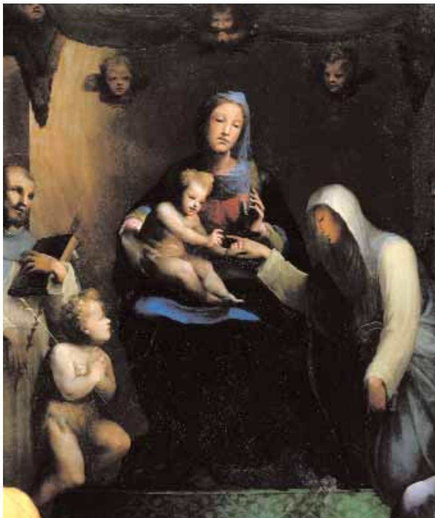
Domenico Beccafumi, Le Mariage mystique de sainte Catherine. Détail. Sienne, palais Chigi Saracini

La collection fait aussi la part belle à l'école maniériste. On peut notamment y admirer une gracieuse Allégorie de l'Amour céleste du Sodoma, une œuvre de jeunesse influencée par Léonard et le