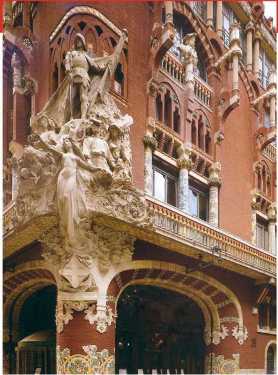
Lluís Domènech i Montaner, Palais de la musique catalane , Barcelone.