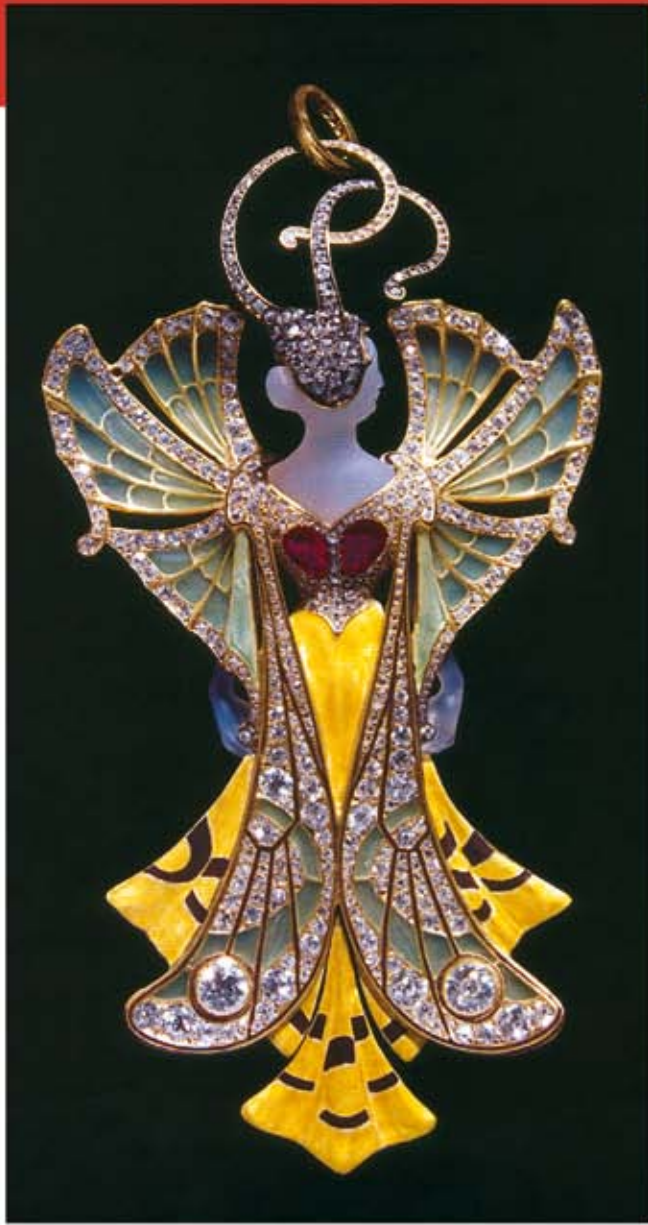
Paul et Henri Vever, pendentif Sylvia .