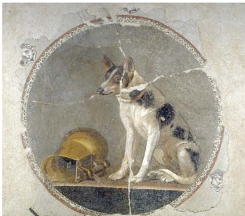
Alexandrie, palais des Ptolémées : mosaïque représentant un chien.