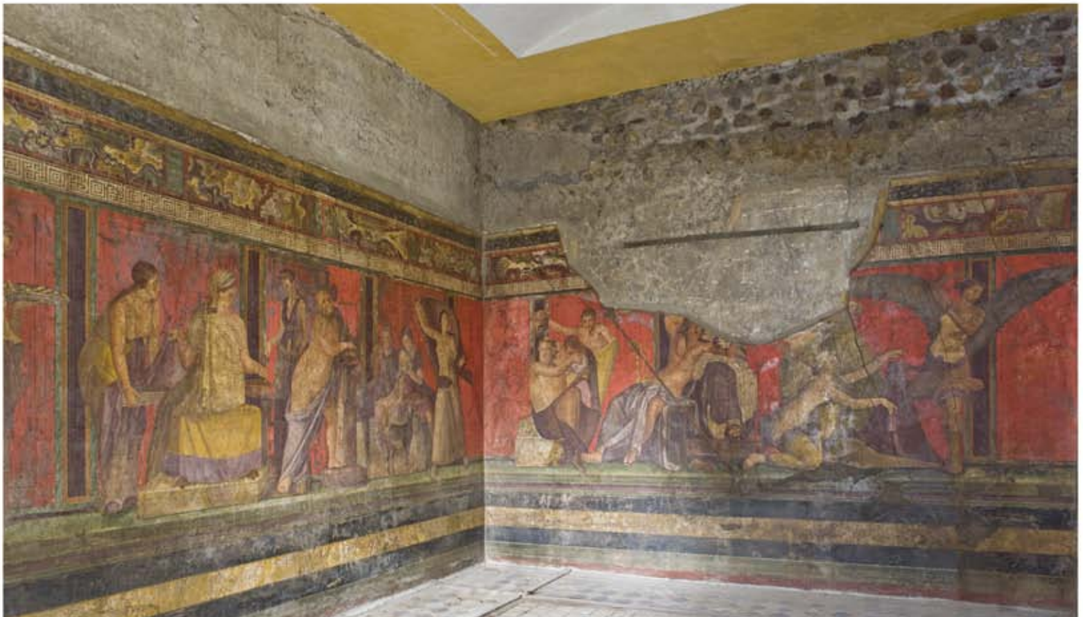
Pompéi, Villa des Mystères, salon 5 : vue générale.