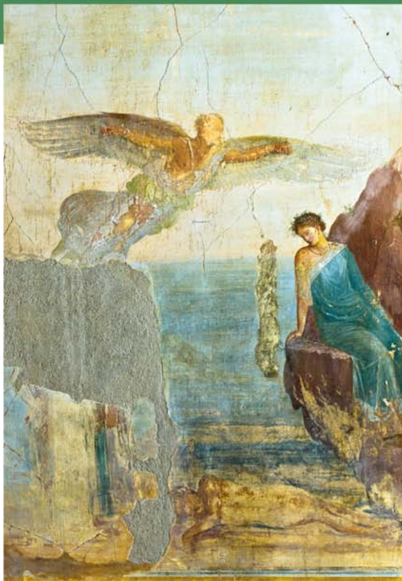
Pompéi, Villa Impériale, grand salon : le tableau de la chute d'Icare sous le regard d'une nymphe. En haut : Dédale, dont le nom est inscrit en grec.