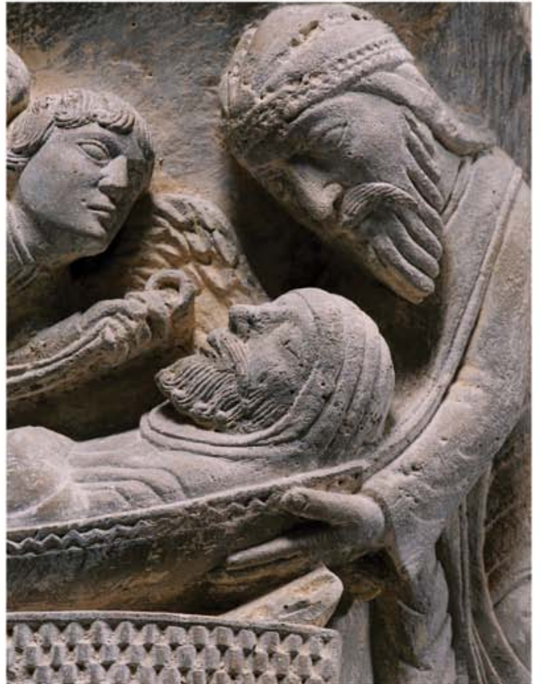
Melle (79) Saint-Pierre, détail de la mise au tombeau, Joseph d'Arimathe et un ange au-dessus du Christ mort.