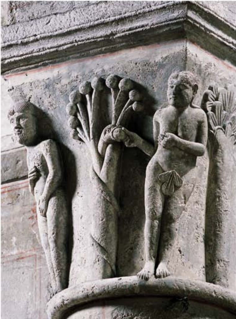
Chauvigny (86) Notre-Dame, croisée du transept, Tentation.