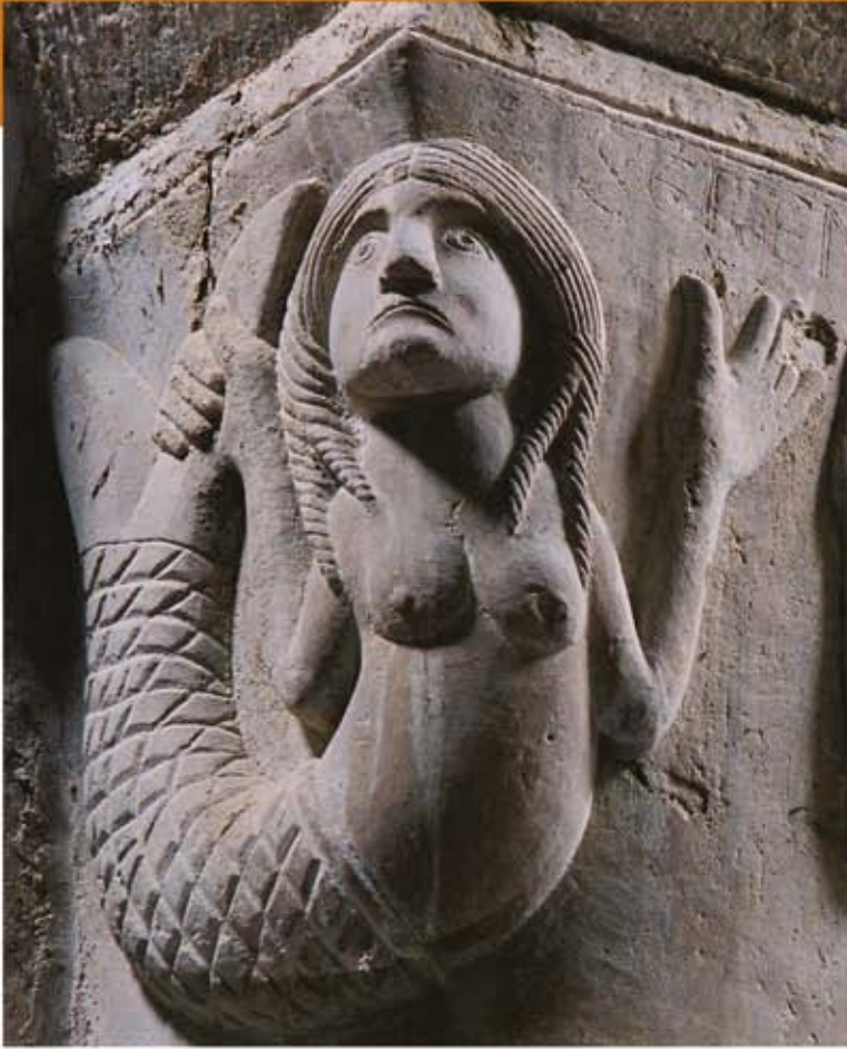
Parthenay-le-Vieux (79) Saint-Pierre, abside centrale, Sirène.