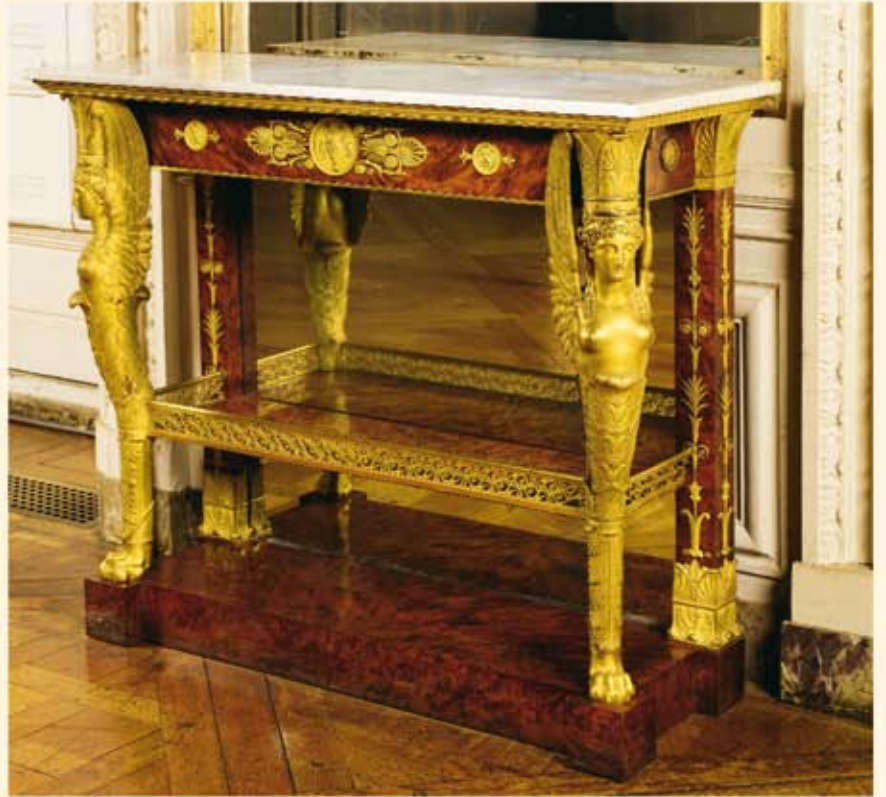
Console de Jacob-Desmalter, d'après un dessin attribué à Charles Percier.