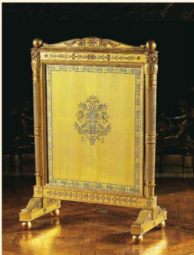
Ecran d'un ensemble comprenant dix fauteuils, douze chaises, livré en 1811 par Pierre-Gaston Brion, dorés en 1830 par Pettrelle et Fontaine et garnis par Lafèche d'une soierie fournie par Nicolas Yéméniz.