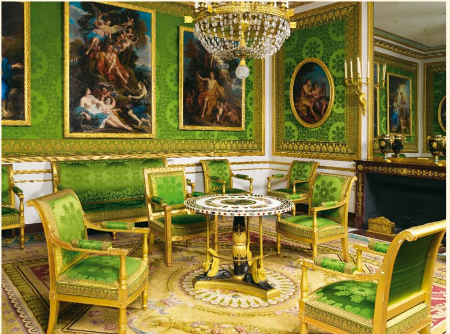
Cabinet de Napoléon I er , au Grand Trianon.