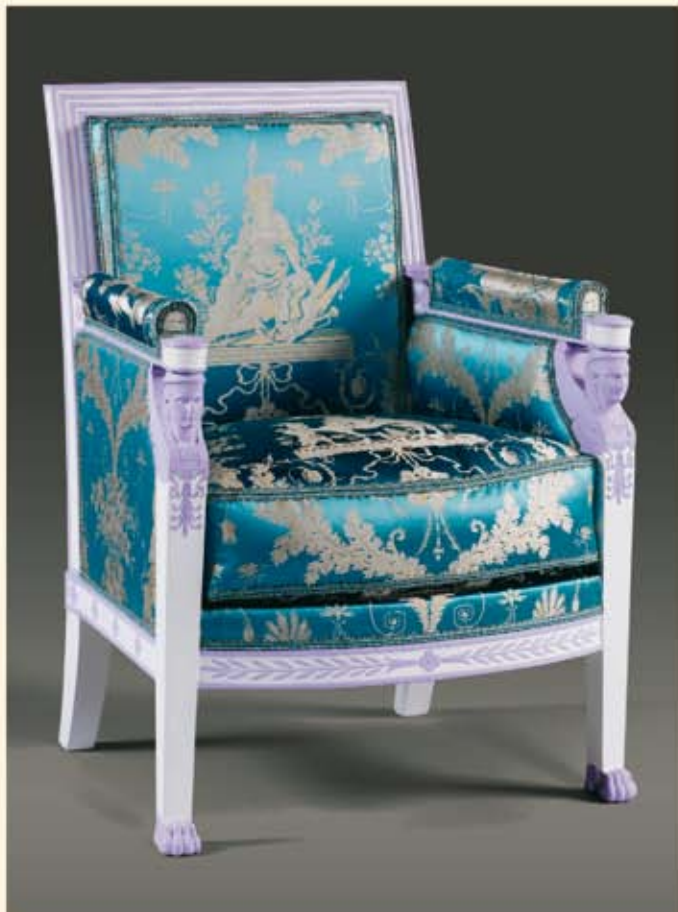
Bergère d'un meuble de salon comprenant deux bergères, quatre fauteuils et huit chaises estampillés Jacob-Desmalter / R. Meslee.