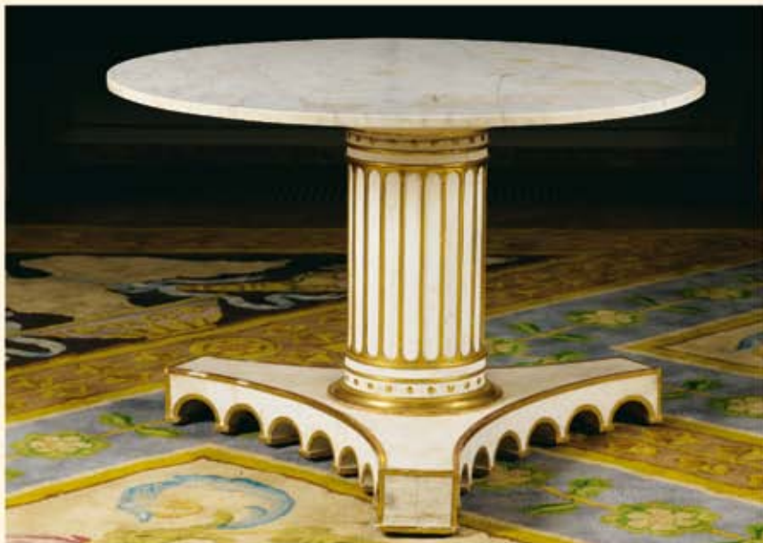
Guéridon livré par Jacob-Desmalter et Cie pour le salon de musique du Petit Trianon en 1811