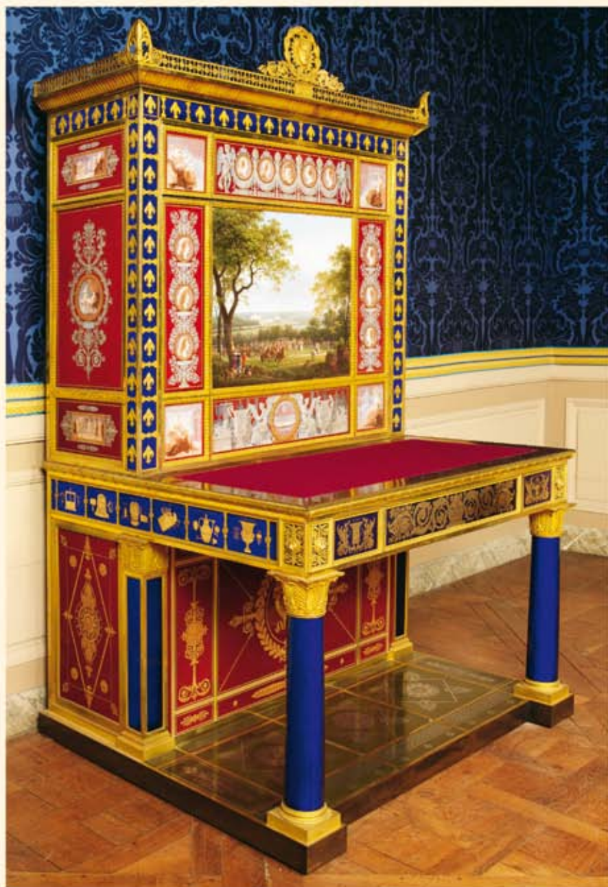
Cabinet-secrétaire fabriqué entre 1824 et 1829, la plaque centrale en porcelaine de Sèvres est signée et datée Robert en 1827.