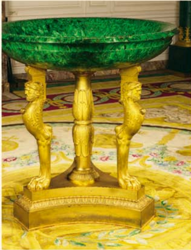
Vasque réalisée avec les malachites offertes par Alexandre I er à Napoléon.