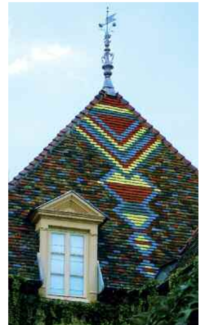
Maison, n° 31 rue de la Préfecture, Dijon.