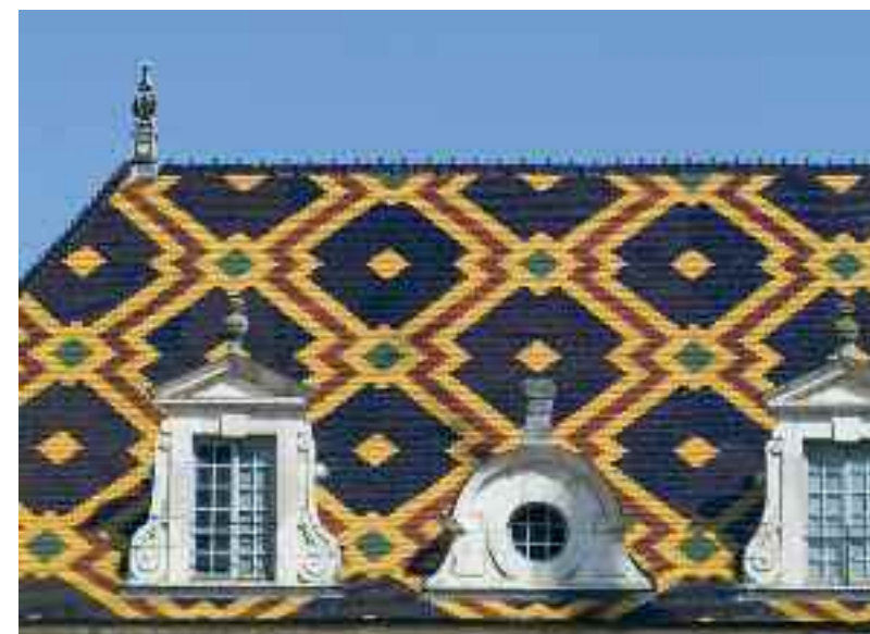
Couverture actuelle de la salle Saint-Louis de l'hôtel-Dieu de Beaune.