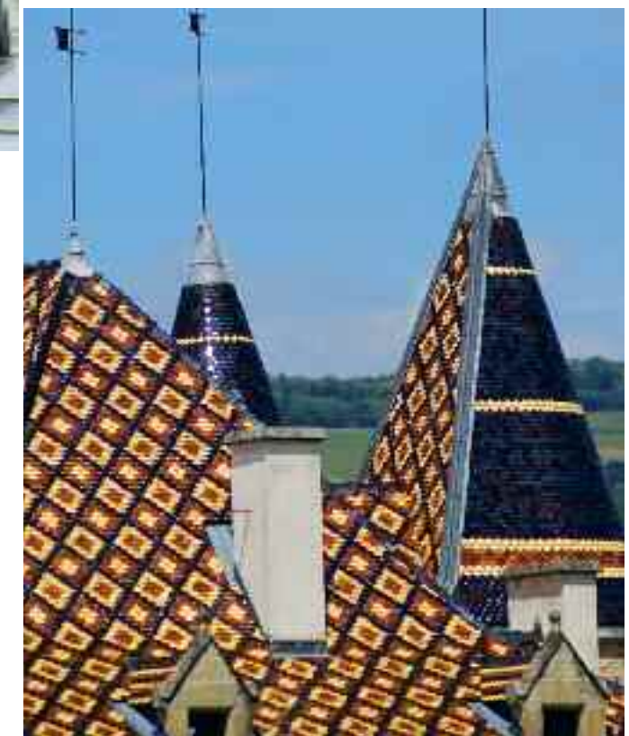
Château de Pupetières, Virieu-sur-Bourbre (Isère).