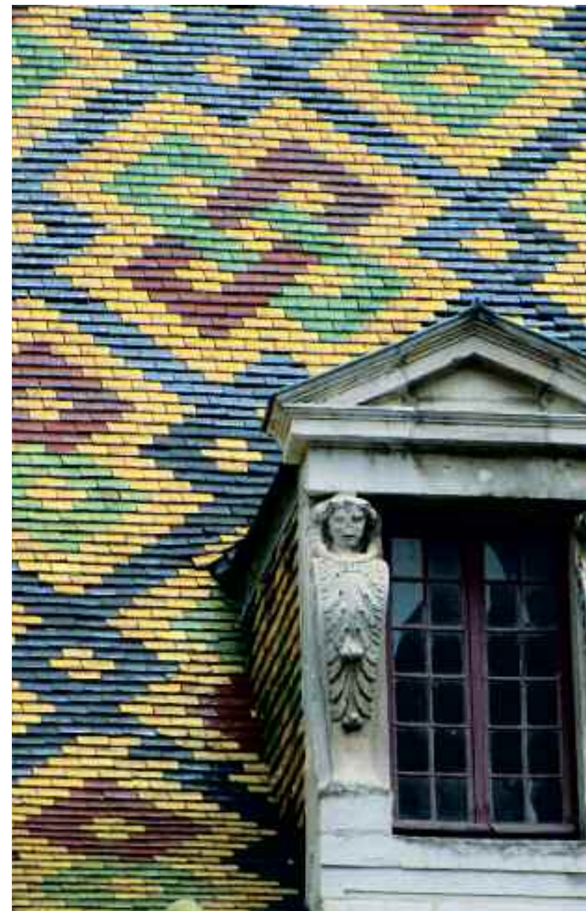
Anneaux entrelacés du toit de l'hôtel Aubriot, Dijon.